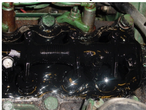
Vasket 30 minutter med konkurrerende vask