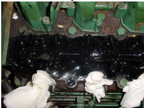
Volvo Penta Dieselmotor før innvendig motorvask

Her ser vi en olje som er blitt sterkt oksidert, bli effektivt fjernet fra motoren med QMI Innvendig Motorvask